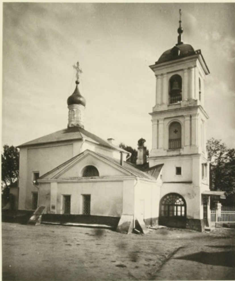
1880 г. Ч. Ш. О. П. 1. 200 г.