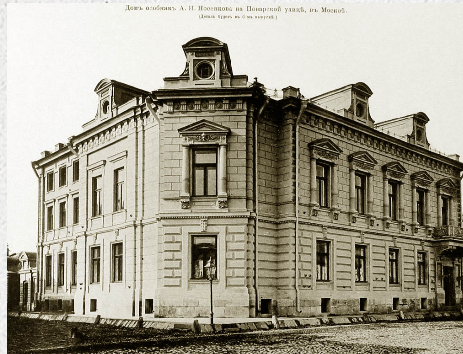
Проектир. и постр. А. С. Каминский.

В 1887 году участком владел фабрикант и торговец скобяным товаром А.И. Носенков. Для него и был выстроен существующий ныне дом со всеми службами. Сейчас в нем находится Венгерский Культурный центр.