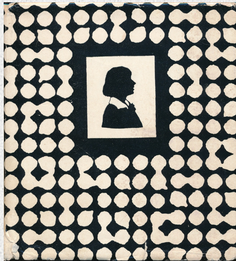
М.Цветаева. Книга. Мой Пушкин. - М.: Советский писатель, 1967. Из собрания Музея

Мы прошли по пушкинским местам Борисоглебского переулка. В следующий раз, когда вы придете в наш музей, вы побываете в гостях сразу у двух поэтов: у Александра Пушкина и Марины Цветаевой, которая называла Пушкина своим первым поэтом, научившим ее «свободной стихии», которая «оказалась стихами, а не морем, стихами, то есть единственной стихией, с которой не прощаются - никогда».